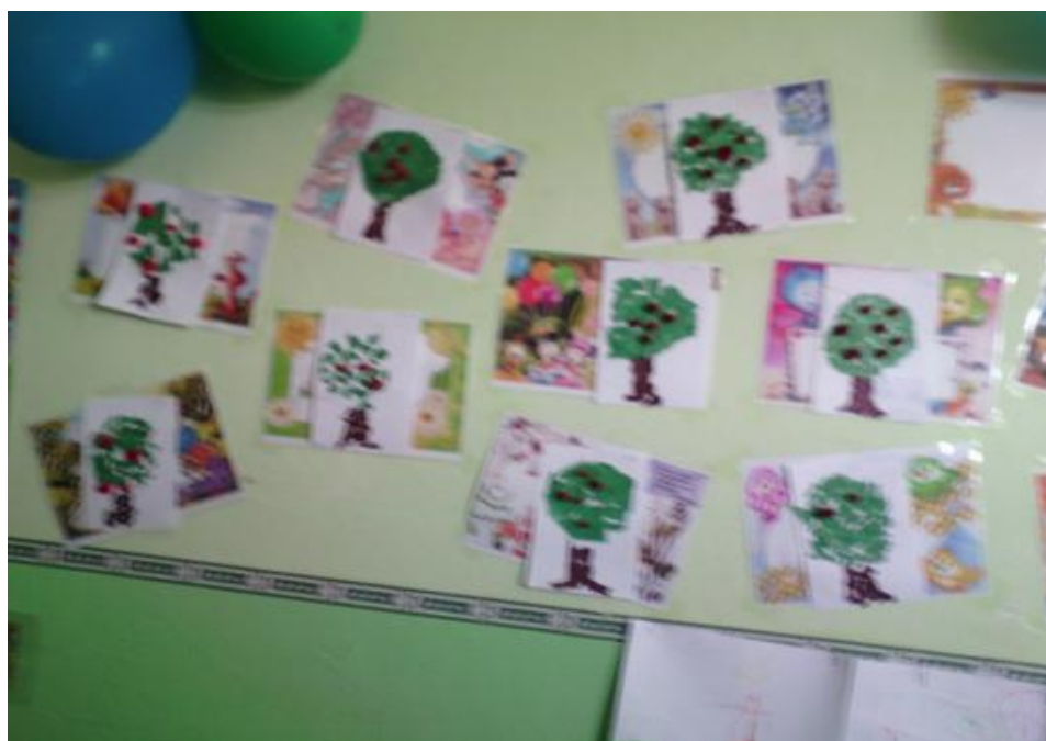
Автор публикации: воспитатель Панковец М.А.