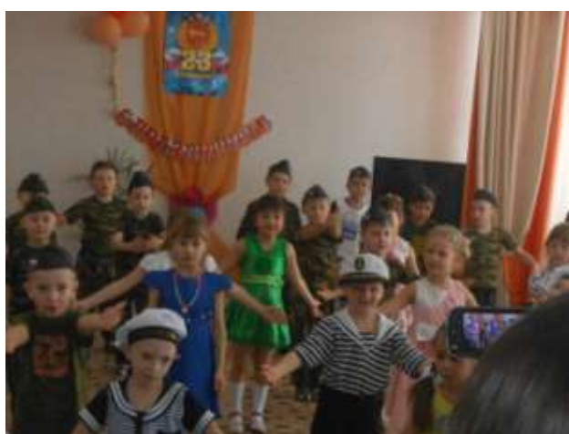
А теперь – весёлый танец «Барбарики»

Ну, а сейчас настало время для разминки!