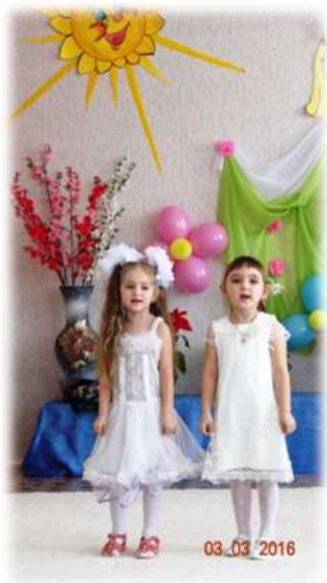
Танец с цветами